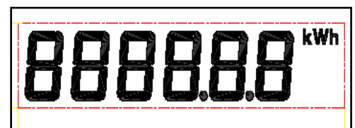
LCD Display – 6 digits