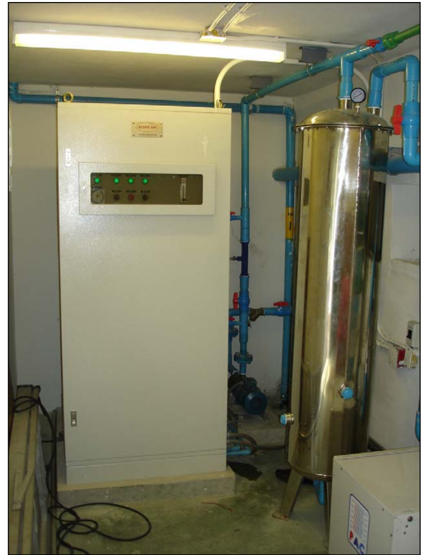
L&H Sukhumvit 79