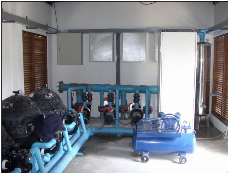
Regina Khaolak Resort & Spa