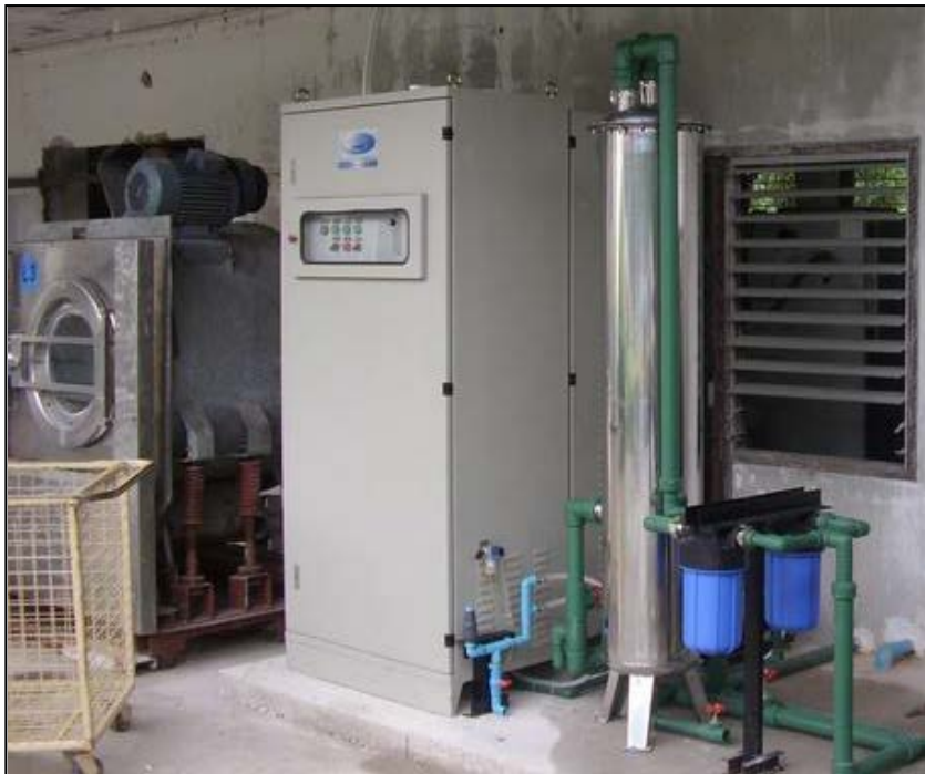
Grand Jomtien Pattaya