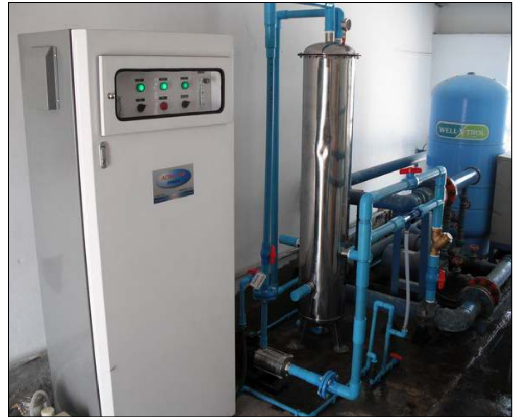
ระบบโอโซนฆ่าเชื้อโรค Disinfecting by Ozone