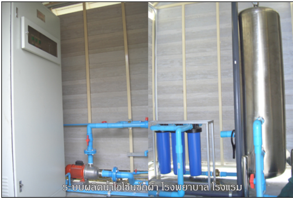
ระบบผลิตน้ำไอโซนซีกผ้า โรงพยาบาล โรงแรม