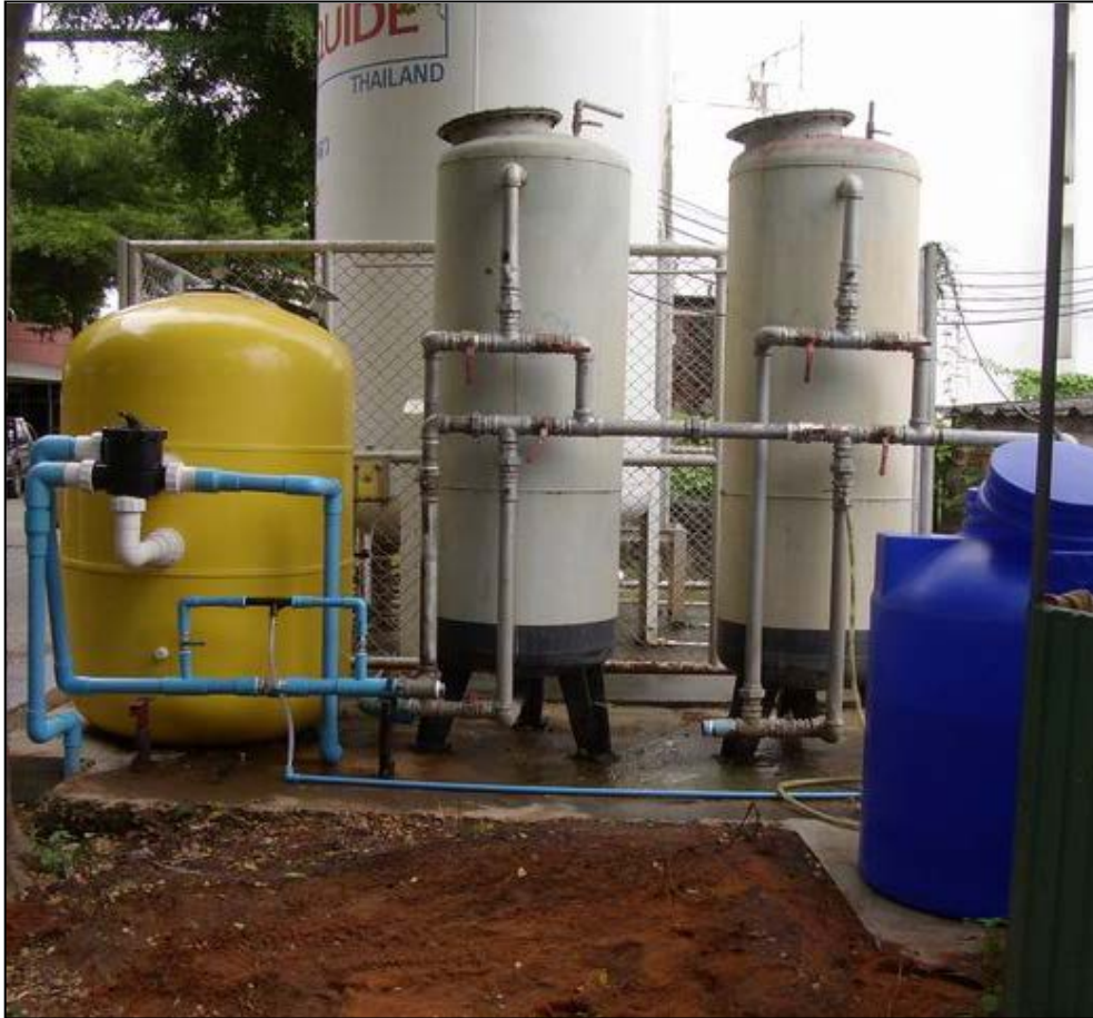
ระบบกรอง Filtration