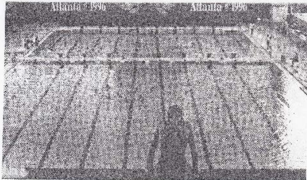
การใช้โอโซนในสระโอลิมปิกที่เมืองแอตแลนต้า สหรัฐอเมริกา (Clear Water Tech. Inc)